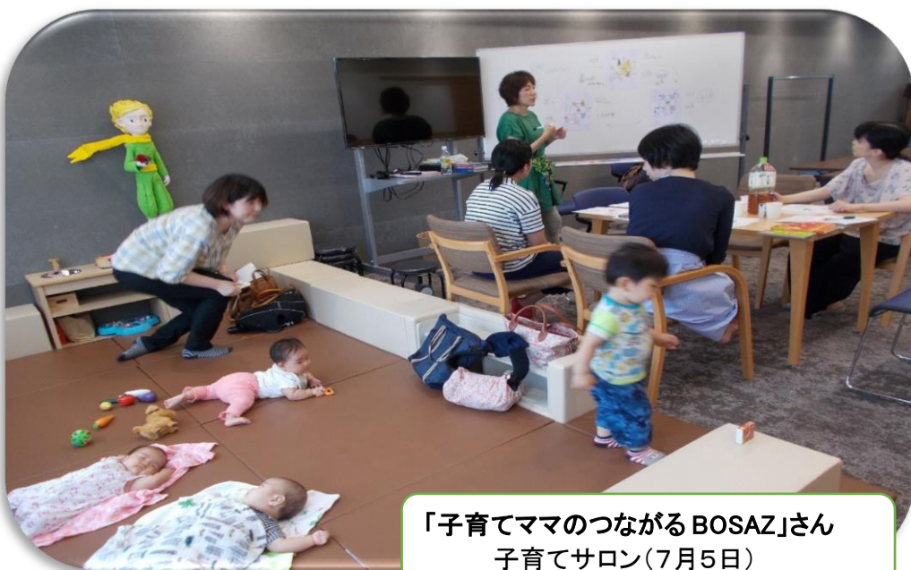
「子育てママのつながるBOSAZ」さん 子育てサロン(7月5日)